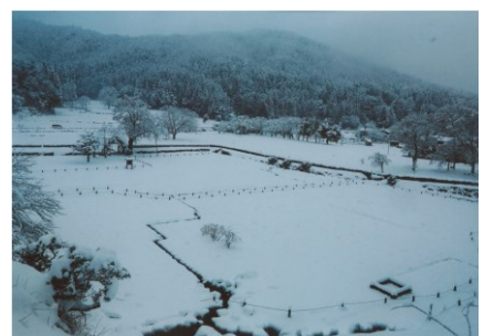
優秀賞 室田昇 様