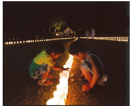
優秀賞 渡辺修一 様