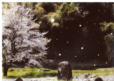
優秀賞 竹内俊郎 様