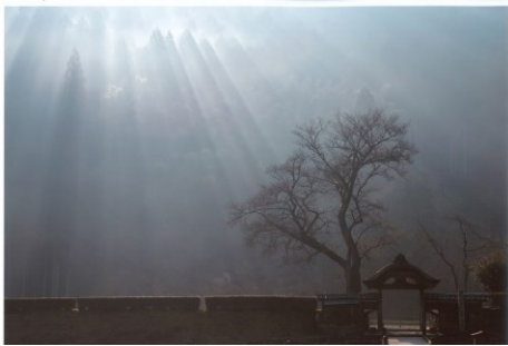
優秀賞 坪田吉晴 様