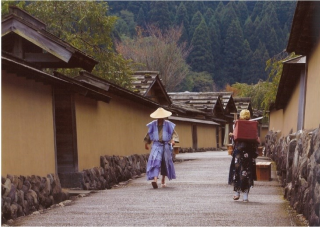
最優秀賞 高木紘治 様